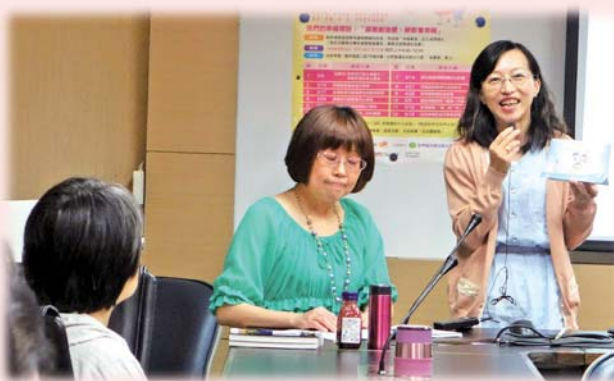
分享製作幸福標語的過程與心情

感謝世界和平婦女會、感謝講師以及一同學習分享的伙伴，相信大家會愈來愈幸福！培力進階課程開始了，我們朝向帶領人的目標而邁進，期望把這美好的理念傳達給更多人。