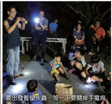
要出發看螢火蟲，等一下要關掉手電筒