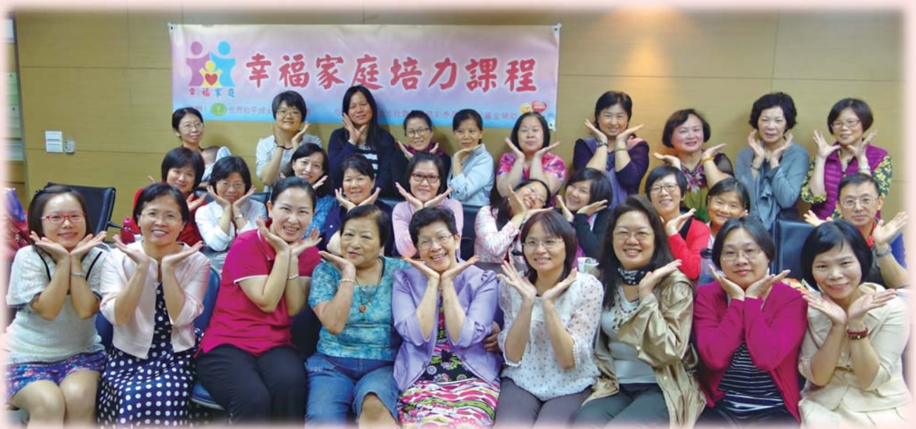
大合照：看我們幸福的不得了～愛要分享才會更幸福！

感謝散發幸福香波、提供學習平台及對推廣幸福家庭培力的世界和平婦女會，還有每位講師的提點和幸福願景的教導。這是「幸福」來招手之後的開端而已，「她」告訴我，當我尋找幸福，我必幸福。