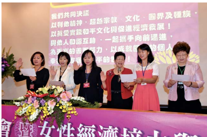
發揮同理心及幫助別人的能力！「亞洲女企業家和平網絡與愛心慈善國際合作平台」其中五位女企業家率先發表行動宣言，——展開支持平台的具體行動！

超能力又是什麼呢？第一個就是要「把夢想做大的能力」，當很多人都在問什麼樣的領導人能夠帶領組織，突破創新呢？管理大師杜拉克就提供了一個說法：時代的轉變剛好符合女性的特質，現在的社會是一個價值大於價格、多元取代單一的時代，於是女性柔軟細膩體貼的特質更符合現在社會的需要。第二個是「不怕挑戰的能力」，因為通常女性的優勢就是挫折的忍耐度，一次次的挫折會讓女性變得更堅強，在挑戰面前妳要展現妳絕對不屈服的韌性。第三個就是要有「幫助別人的能力」，從觀察國際慈善公益的變化其中之一就是女性慈善領袖的出