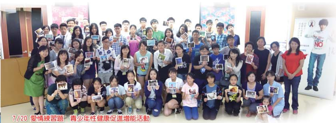
7/20 愛情練習題 青少年性健康促進增能活動