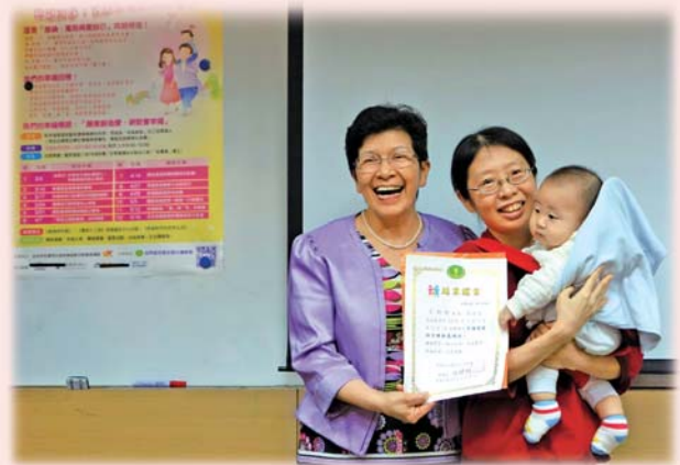
最佳學習精神獎頒給明俐母子檔！聰明的媽媽給孩子最好的投資教育就是「一起學幸福」

感謝將愛分享出來的帶領人，感謝有緣相聚的姐妹，大家投入學習的樣子真的很有力與美，感謝在這裡領受到的鼓勵。這課程幫助我