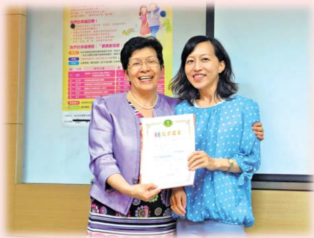
認真學習的女人～最美麗