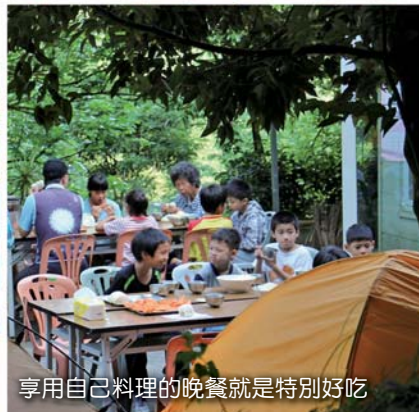
享用自己料理的晚餐就是特別好吃