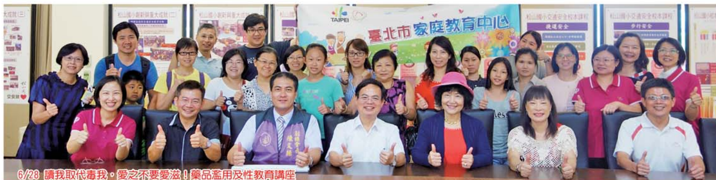
6/28 讀我取代毒我。愛之不要愛滋！藥品濫用及性教育講座