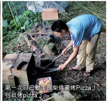
第一次自己動手做柴燒窯烤Pizza！ 可以烤pizza了