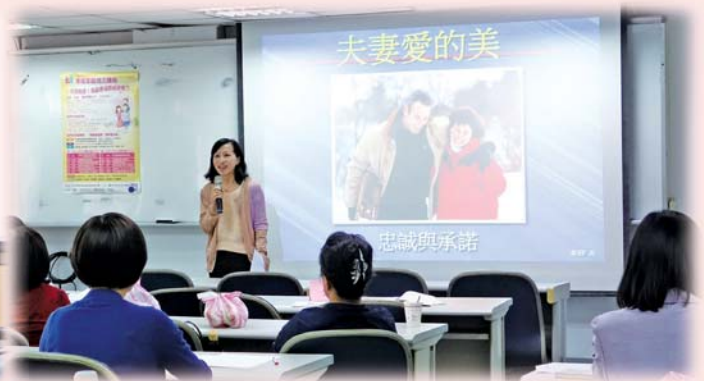
了解夫妻原生家庭的差異並接納包容