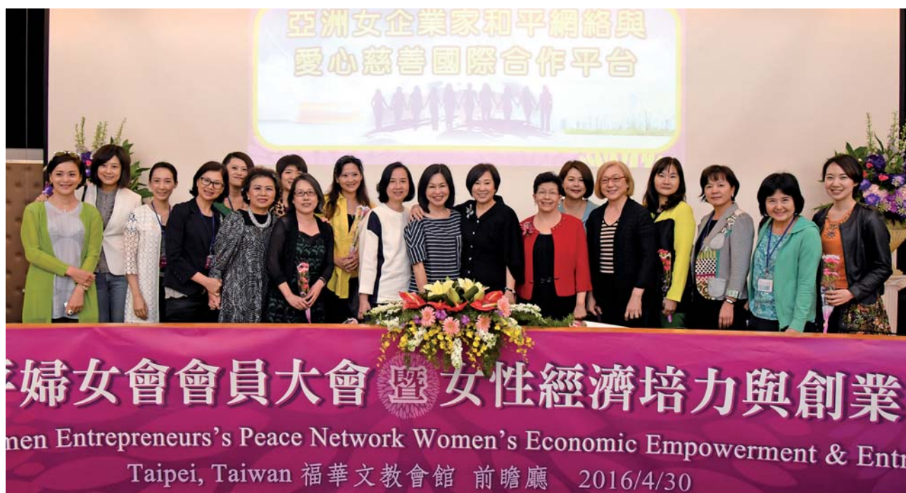
余湘總裁與紅果子群英會一起見證「亞洲女企業家和平網絡與愛心慈善國際合作平台」的正式啟動！

把夢做大，不要害怕面對問題、挫折與挑戰，不要害怕自己孤立無援，因為當妳渴望成功，全宇宙都會幫妳，妳應該要有信心，成功一點都不可怕。