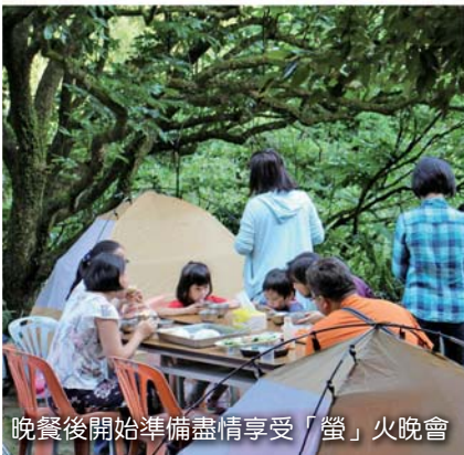
晚餐後開始準備盡情享受「螢」火晚會