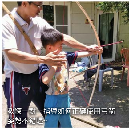
教練一對一指導如何正確使用弓箭 姿勢不錯喔~