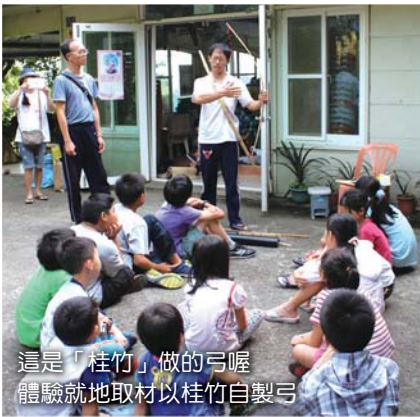
這是「桂竹」做的弓喔 體驗就地取材以桂竹自製弓