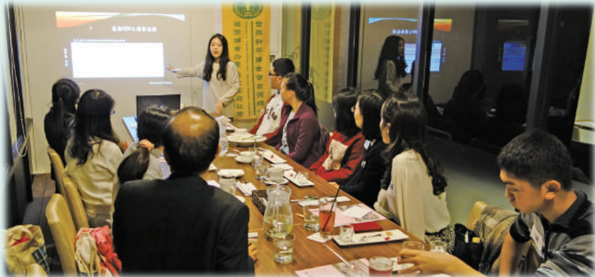
巧兒分享校園入班宣導經驗與心得

後來老師引導我們去想：「聽」與「說」哪個重要？或許每個人的看法都不同，但是我們一定要記得懂得傾聽，這在服務或其他方面也是很重要的。最後談驊老師舉了新加坡李光耀的故事做為整晚的結尾：李光耀先生曾經派專家團隊到台灣考察為何蜂蜜比新加坡的還甜，經調查之後才發現原來是台灣的蜜蜂必須飛行較遠的距離才能採集到花蜜，因此牠們會選最好的花朵，相較之下，新加坡是花園城市，蜜蜂隨處可採集到花蜜，就不在意好壞，於是產出來的蜂蜜就沒那麼甜了。透過這故事，老師鼓勵我們勇敢嘗試自己不願