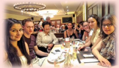
週末晚上和年輕學員一起體驗一下德國大學生的 Pub 生活

研習德文的學生來說都能在課業之外對於德國的人文素養有更進一步的了解，落實研習德文的主要目的與意義。美好時光很快就過去了，短短數週的圓夢之旅也到了尾聲，同學們依依不捨互道珍重祝福並相約後會有期！這真是一次獲益匪淺，豐富又永難忘懷的圓夢之旅！