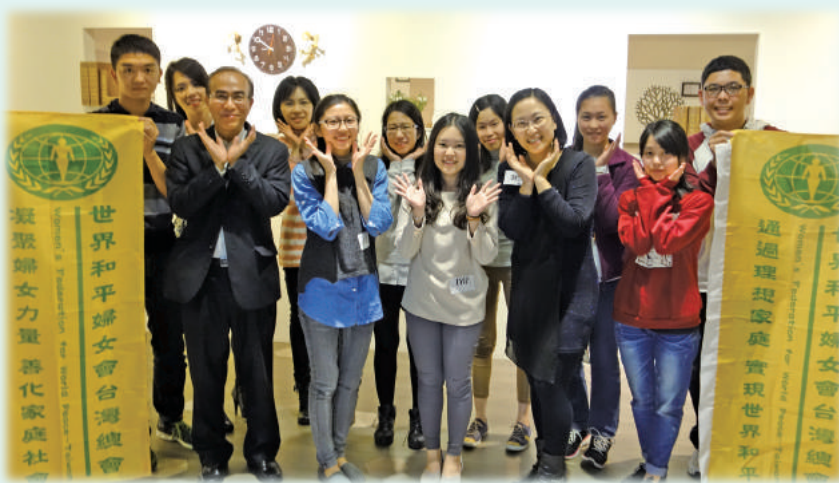
青年志工月會的開心合影

意、不想做、不敢做的事情，突破舒適圈並行動起來，共同當一隻台灣的蜜蜂去散播更多的力量與影響力！