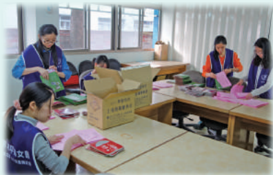
志工們忙碌於為院童包裝聖誕節禮物

第一位分享在醫院實習工作的點滴，雖然在醫院上班每天都有一套 SOP 流程的例行公事，但她覺得這不只是一份工作而是真心在助人，所以她當在服務這些病友和家屬時都會得到他們的青睞與感謝，這是因為用「心」在服務他人，彼此能從中感受到服務的溫度。