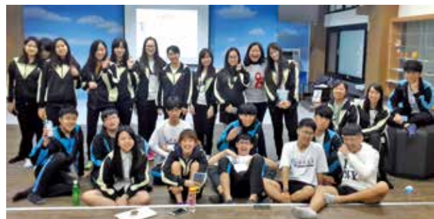
新店高中入校宣導