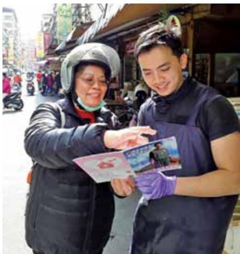
拒菸守護大使向雞肉攤小老闆宣導