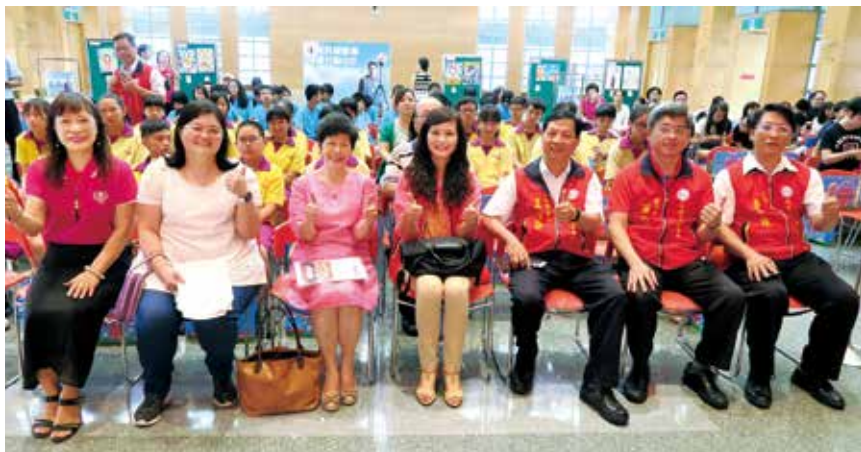
主辦單位新北市衛生局與承辦單位 世界和平婦女會 及與會貴賓合影

此次創意活動投稿踴躍，國小組彩繪「無菸家庭」作品共209件、心得寫作125件；國中組彩繪「無菸校園」作品共11件、心得寫作共21件；拒菸守護大使心得寫作共收到6件。雖然審閱參賽作品費時不少，但是小尖兵和大使們的故事都令人印象深刻。還記得有些學生是因為接觸過菸品被老師強迫參加，但同學們依然願意花時間在假日分小組，到附近賣場進行一日拒菸小尖兵的宣導訪問，透過學校的加強宣導和執行任務的過程中，讓他們更深刻體認到菸對人體危害真的很多，受訪的路人甚至也因此覺察自己最近健康下滑的原因，開始想減少吸菸的頻率來逐步戒菸。因為一個小小的行動或許就能推動吸菸者想改變的心意，我想這就是拒菸小尖兵和拒菸守護大使所能帶來的最好結果！