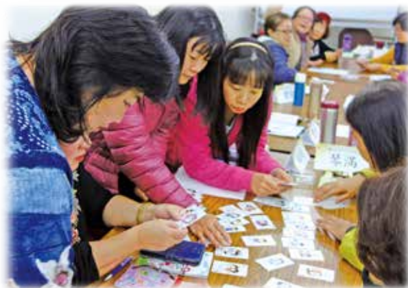
學習運用五種「愛的語言」，創造美好的關係