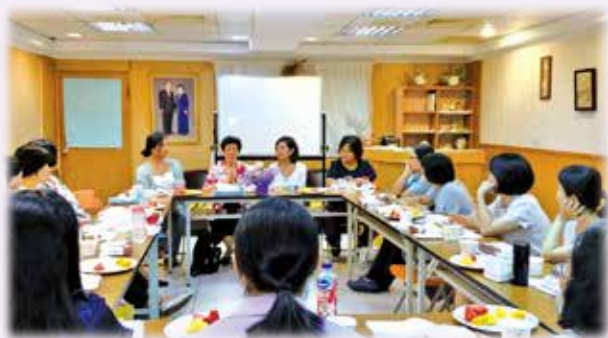
高雄服務中心籌備會議

自106年度8月開始籌辦，及規劃下展開高雄服務中心的推展工作，舉辦排舞課程、心靈成長讀書會及不定時的聚餐聯誼與文化活動，通過彼此交流學習成長。