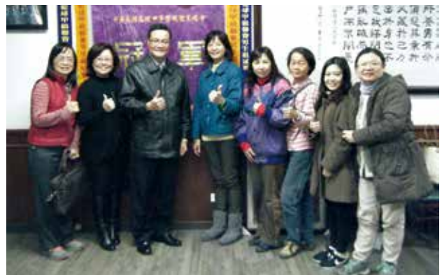
能仁家商講師們與校長合影