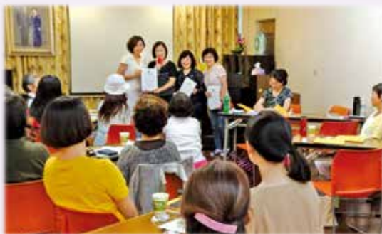
學員熱心參與學習且全勤獲頒結業證書