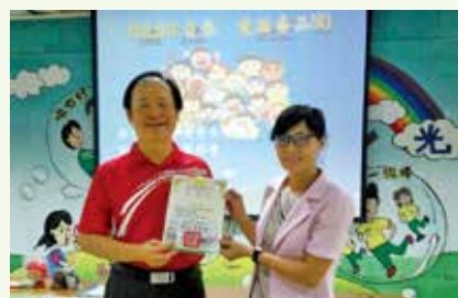
屏東縣瑞光國小頒感謝狀給講師