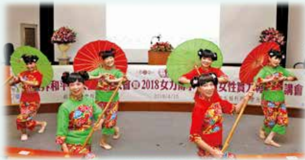
開幕舞蹈 - 汐止社區大學 民族舞蹈班