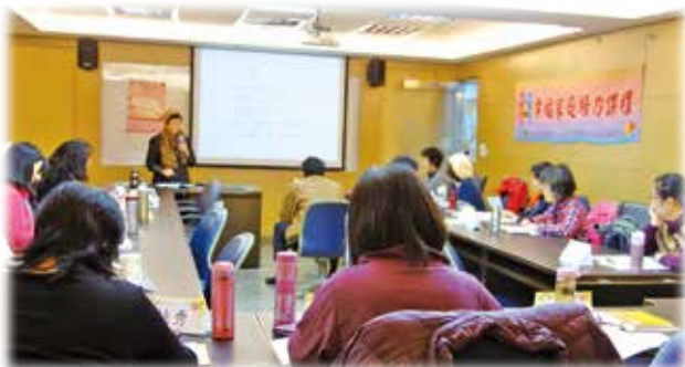
幸福從自己的改變開始

路運動，讓我很感動。另一方面，心裡很期待出去散步時可以和老公手牽手，但他不願意，我的心裡感到難過。我察覺到內在有一個不滿足的小孩在哭泣，當天回家後，我靜靜地陪伴著內在的小孩，擁抱她，給她愛。第二天，第三天散步，雖然老公依然沒有牽著我的手，但因我內在小孩已被照顧，就覺得沒有關係了。