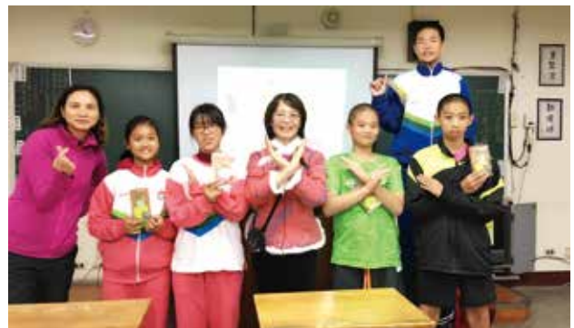
國中入班宣導講師與得獎同學及導師合照