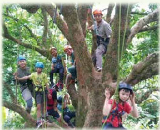
來張合照吧！大部分的孩子都通過攀樹體驗