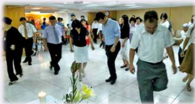
男女老少咸宜的排舞