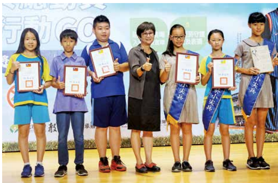
國小彩繪無菸家庭 獲獎者與頒獎人新北市衛生局高淑真副局長合影

當中不僅欣賞到同學的創意巧思，也可以感受到他們對於活動的用心及對家人親友健康的關心，並將所學與生活的經驗連結，讓宣導的效益可以藉由小尖兵們擴散延續下去。有的同學一開始很害羞，不知道怎麼開始進行，父母馬上就給予支