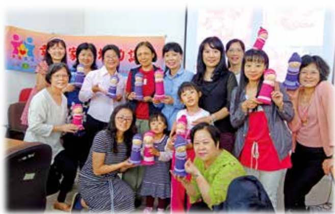
「幸福體驗」手作傾聽娃娃，進行自我療癒

上了幾堂課之後，我漸漸找回自信，把自己打扮美麗，用溫暖愉悅表情代替以前的苦瓜臉，用心經營家人關係，很奇妙的，原本對家庭疏離的先生和孩子，開始有了正面的回饋，現在先生留在家裡的時間變長了，孩子的互動也變多了，現在的自己活得比以前快樂很多。在課程結業式時，我收到的祝福卡片是「我在愛裡面、愛永遠都在」，我心裡覺得很感動。感謝這個課程帶給我的轉變，也感謝同學給我鼓勵、支持與關懷。