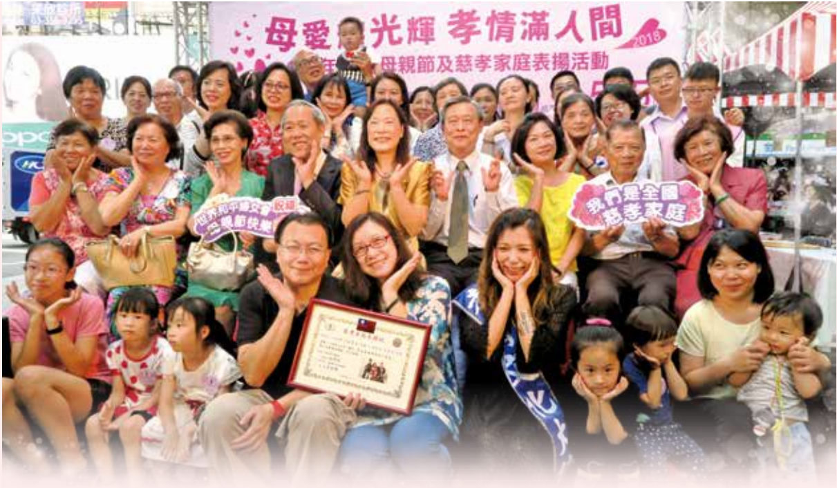
受表揚家庭大合照