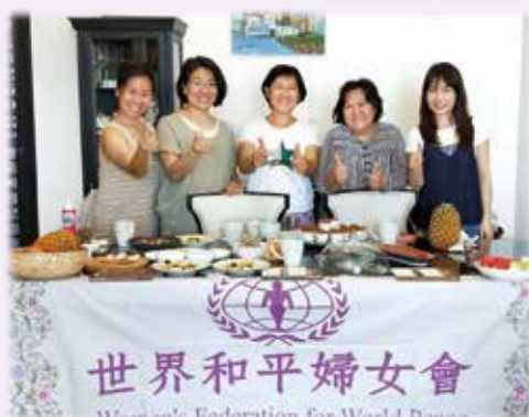
水果酵素教學 健康美味又養生