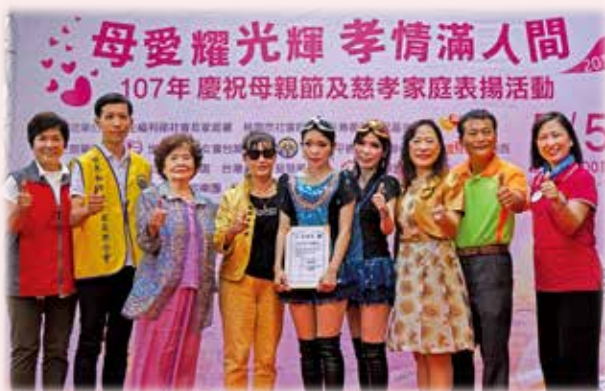
表演者與各協辦單位負責人合影

會場除了趣味闖關和公益義賣外，還有精油按摩、蝶式挽面體驗，讓媽媽紓壓健康與美麗。完成闖關者還可以獲得精美小禮物。